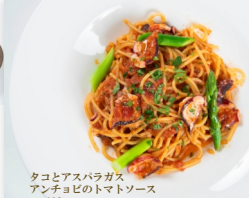
タコとアスパラガス アンチョビのトマトソース スパゲッティ