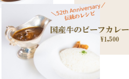
52th Anniversary / 伝統のレシピ 国産牛のビーフカレー ¥1,500