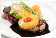
ハンバーグ焼パイナップル添え —デミグラスソース&トマトソース— ¥1,300