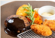
ハンバーグ&牡蠣フライ —デミグラスソース— ¥1,800